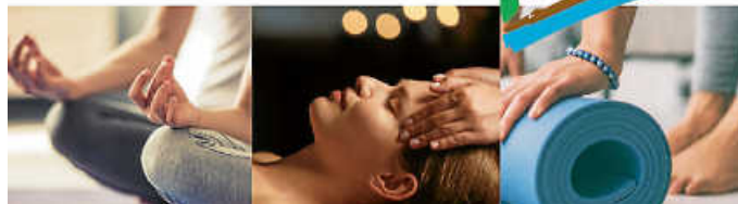
Prävention - Vorbeugen und Geld sparen!