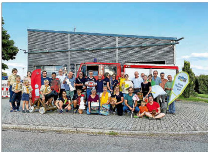
Gruppenbild mit (Spiel-) Kanone, Schachfigur, Steckenpferd, Huhn und Vertreter:innen aller bei der Erlebniswanderung beteiligten Vereine und Organisationen

Der Rundweg um Neusatz und Rotensol herum ist 8 km lang - nicht zu lang, nicht zu kurz für eine schöne Wanderung in unserer wunderbaren Landschaft. Den Auftakt macht um 9.30 Uhr die Evangelische Kirchengemeinde mit einem Gottesdienst am Sportplatz in Rotensol. Danach ist viel Abwechslung geboten, auf dem Wanderweg selbst und an insgesamt 16 Stationen, alle von ortsansässigen Vereinen oder Betrieben mit großem Einfallsreichtum gestaltet. Wann und bei welcher Station sie einsteigen und wie viele Stationen sie „abklappern“ (wir hoffen natürlich: alle) entscheiden Sie selbst. Jede von ihnen lohnt sich!