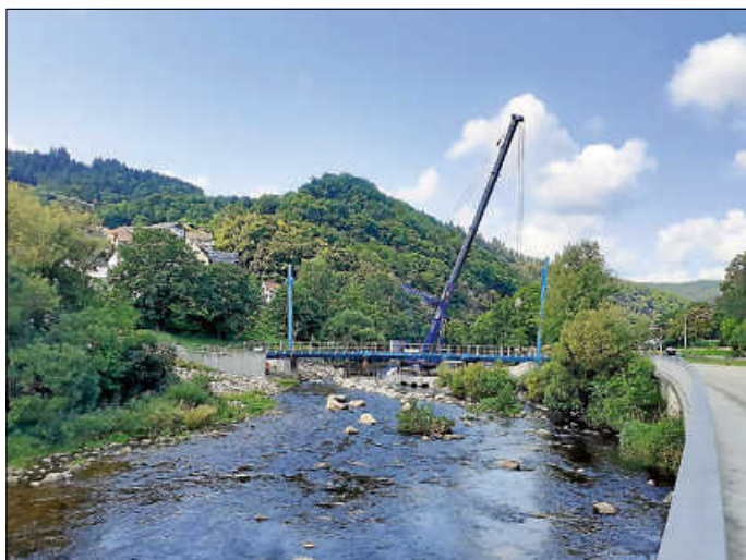
Einhub des Überbaus

In den kommenden Wochen werden nun noch die Fahrbahnplatte auf dem Überbau betoniert und das Brückengeländer vervollständigt sowie Asphaltarbeiten in den Anschlussbereichen ausgeführt. Darüber hinaus müssen noch alle nachgelagerten Arbeiten, wie das Nacharbeiten des Korrosionsschutzes und der Rückbau sämtlicher temporärer Baubehelfe in der Murg, erledigt werden.