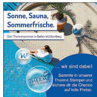
Thermensommer Baden-Württemberg Plakat: HKM und Siebtäler Therme

Jetzt einfach nur noch die Stempelkarte in der Siebtäler Therme abholen und schon kann es losgehen.