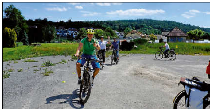
Teilnehmende haben Spaß beim Fahrsicherheitstraining für Pedelecs von radspaß - sicher e-biken.