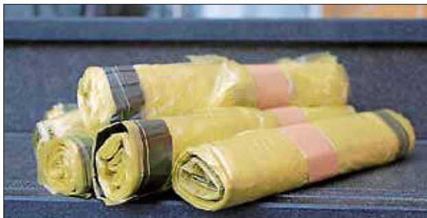
Gelbe Säcke werden in Bad Herrenal und in allen Teilorten verteilt.

Gelbe Säcke erhalten nur Haushalte und Gewerbebetriebe, die keine Gelbe Tonne nutzen. Die Gelben Säcke werden neben den Briefkästen oder am Hauseingang abgelegt. REMONDIS bittet die Nutzer von Gelben Tonnen darum, diese an den betreffenden Leerungstagen möglichst erst abends wieder zurückzustellen. Dann ist für die Verteiler tagsüber ersichtlich, wo tatsächlich Gelbe Säcke benötigt werden. Sollte bei der Austeilung versehentlich ein Haushalt oder Gewerbebetrieb vergessen werden, kann dies REMONDIS unter der Telefonnummer 0800 12 23 255 gemeldet werden.