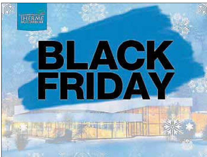
Rabatt-Aktion in der Siebtäler Therme

Sichert euch euren Rabatt am 23.11.2018 - natürlich nur solange freie Termine vorhanden sind.