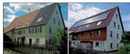
Vorher-Nachher-Vergleich: Sanierung eines Wohngebäudes in Wildberg-Effringen bezuschusst durch ELR-Mittel.

Im Bereich „Arbeiten“ werden Existenzgründungen oder die Verlagerung von Betrieben aus der Ortsmitte in Gewerbegebiete vorrangig gefördert. Der Erhalt einer wohnortnahen Versorgung der Bevölkerung mit Waren und Dienstleistungen des täglichen oder wöchentlichen Bedarfs haben ebenfalls eine hohe Priorität. Ein Beispiel dafür ist der im Oktober 2016 eröffnete Dorfladen der Gemeinde Oberreichenbach.