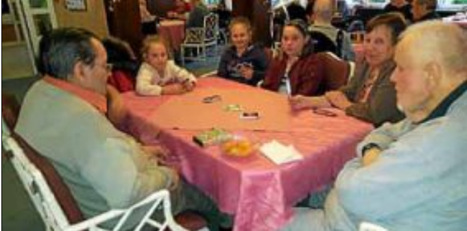
Bei verschiedenen Brett- und Kartenspielen hatten alle viel Spaß und Freude.

In den Herbstferien besuchten einige Jugendliche vom Jugendraum die Bewohner des Parkwohnstiftes Bad Herrenalb zu einem gemeinsamen Spielenachmittag.