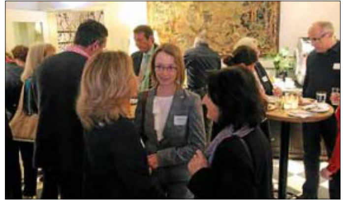
Netzwerken im Rahmen des Tourismus Dialogs

Interessierte Gastgeber, touristische Dienstleister und alle, die sich für die Tourismusarbeit im Albtal interessieren sind herzlich zum Tourismus-Dialog eingeladen. Das Programm sowie ein Anmeldeformular finden sich auf der Homepage von Albtal Plus unter www.albtal-tourismus.de/Service/Gastgeber-Bereich . Die Anmeldung kann auch formlos per E-Mail an info@albtalplus.de erfolgen.