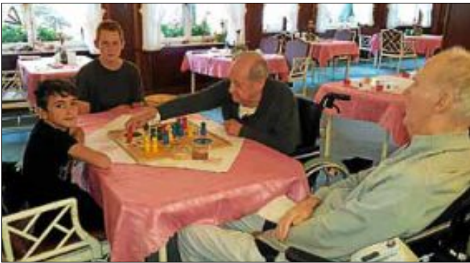
Im Dezember kommen wir wieder zum gemeinsamen Basteln.