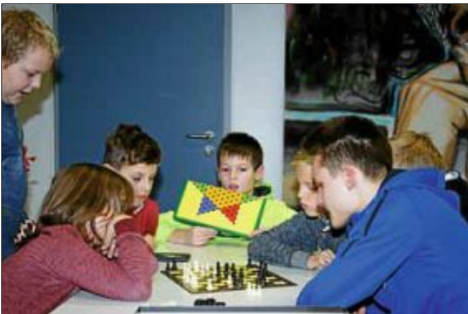
Höchste Konzentration: ASG-Paten der 9. Klasse zusammen mit den Fünftklässlern beim Spielenachmittag

Patenprogramm am Albert-Schweitzer-Gymnasium Lernen einmal anders - Spiel und Spaß am Albert-Schweitzer-Gymnasium. Lernen bezieht sich nicht ausschließlich auf den Fachunterricht! – In der vergangenen Woche wurde das Lernen über den Unterricht hinaus durch ein Patenprojekt erweitert.