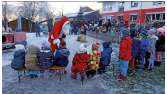
Bei eisiger Kälte warteten alle Kinder gespannt auf den Nikolaus. Das Warten hat sich auch gelohnt, denn er kam wirklich mit vollen Säcken zu uns in den mit Raureif bedeckten Garten.