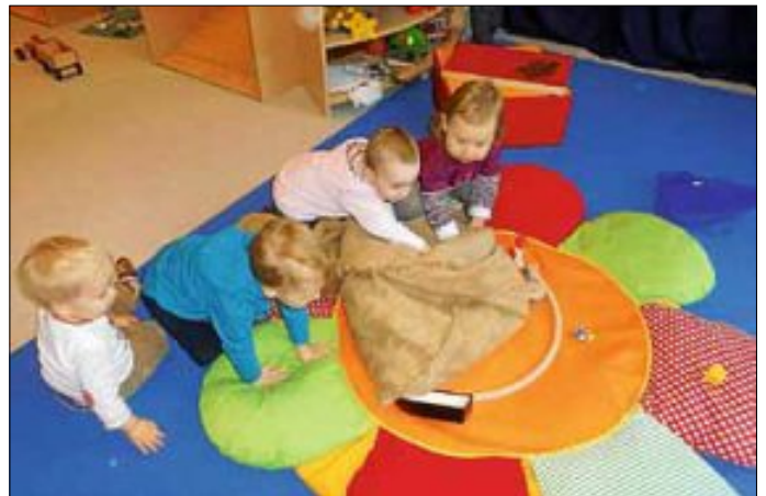
Aus einem klitzekleinen Haus, da schaut der Nikolaus heraus. Er trägt ne Brille klein und rund, ein langer Bart verdeckt den Mund. Er zieht nun seine Stiefel an, damit er los marschieren kann.