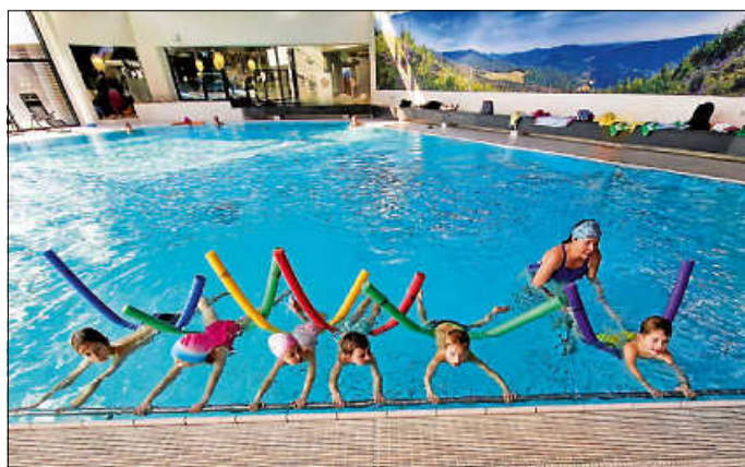
Kinderschwimmkurs in der Therme