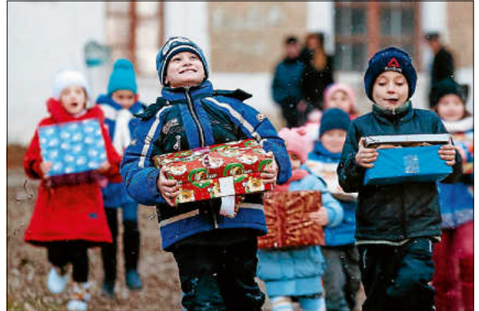
Bald freuen sich Kinder über unsere Päckchen.

Adoptieren Sie ein Päckchen! Nur noch zwei Wochen bis Aktionschluss!