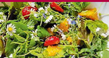
Kräuterhexenküche: Wildpflanzen-Workshop am 19. August