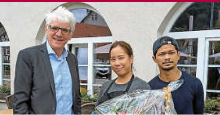
Restaurant „Rimkong“ - Bürgermeister Hoffmann gratuliert zur Eröffnung