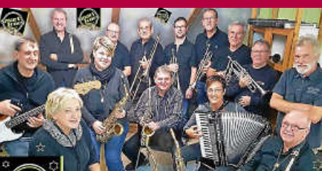
Sonntagskonzert: „SmartTones“ am 20. August