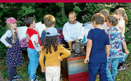
Kindergarten Bernbach: Besuch beim Imker