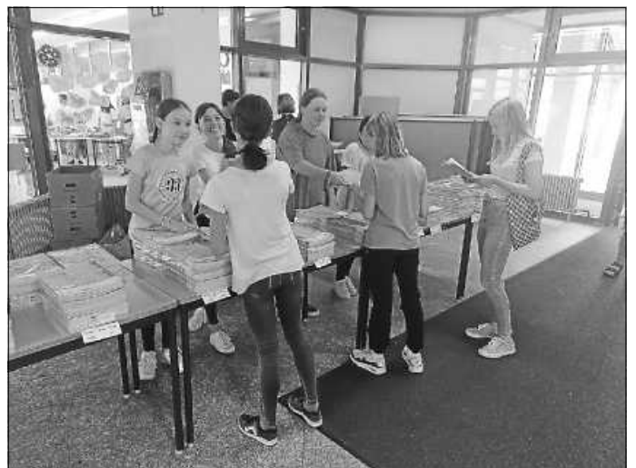
Der Verkauf nachhaltiger Schulmaterialien aus Recyclingpapier wird sehr gut angenommen.

Wir wollen am AMG dazu beitragen, die Kinder und ihre Familien für das Thema Nachhaltigkeit zu sensibilisieren. Dass das nicht trocken sein und mit Verzicht einhergehen muss, hat z.B. der erste Kleidertauschmarkt am AMG im Juli bewiesen. Hier trafen sich bei schönstem Sonnenschein gut gelaunte Kinder, um nicht mehr benötigte Kleidungsstücke zum Tausch anzubieten. Die Stimmung war gelöst, es gab leckere Häppchen und Getränke und fast alle gingen mit einem neuen Lieblingsstück nach Hause. Es werden hoffentlich noch viele Tauschaktionen folgen.