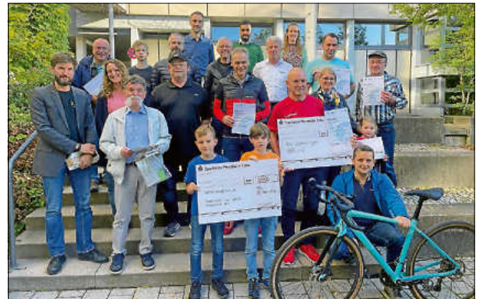
Die Gewinner des diesjährigen STADTRADELN im Kreis Calw.