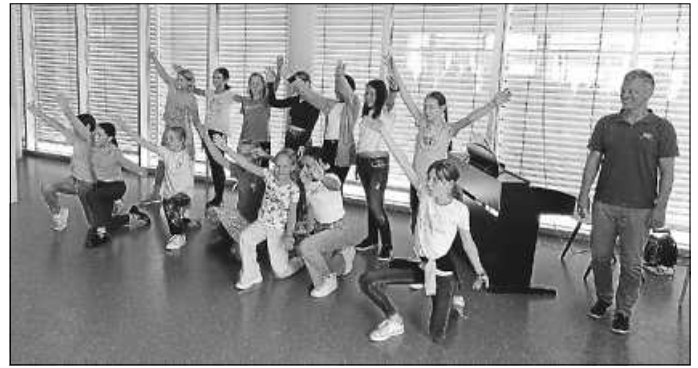
Begrüßung der neuen Fünftklässler am AMG.

Kinder bereits an der Schule zu erwerben, eine Einführung in die digitale Lernplattform „Moodle“ zu erhalten oder sich bei einem Kuchen im Elterncafé der Klasse 6 untereinander auszutauschen.