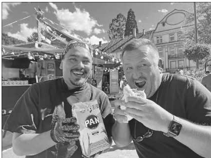
Bombenwetter beschert großen Zulauf an Besuchern.