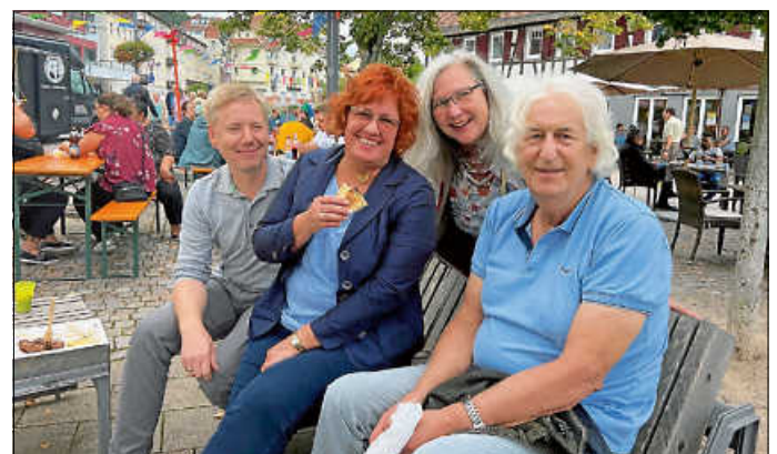
Sogar Besucher aus Neuseeland waren zu Gast in Bad Herrenalb.

(SZ) Mittendrin im dreitägigen Trubel auf dem Rathausplatz und dem angrenzenden Klosterareal boten viele Tische und Bänke