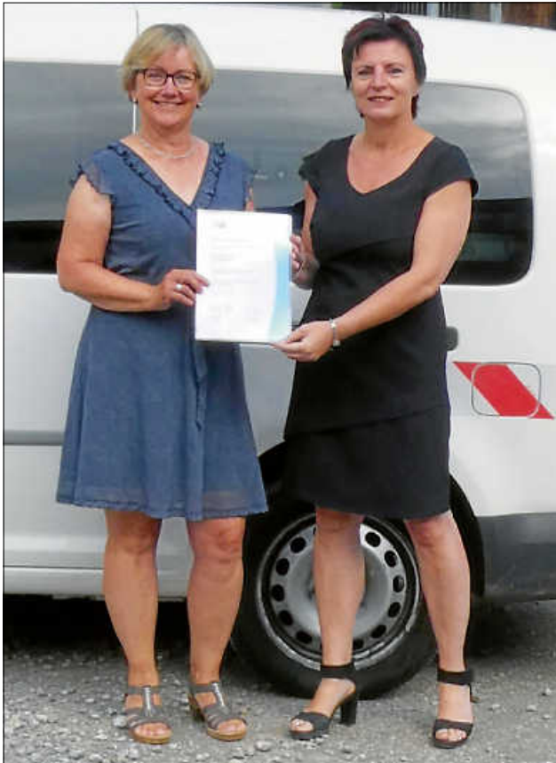
Ehrenurkunde für 20-jährige Betriebszugehörigkeit

Wir dürfen gleich zwei Kolleginnen gratulieren.