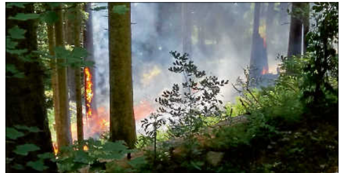
Waldbrand in Bad Teinach-Zavelstein