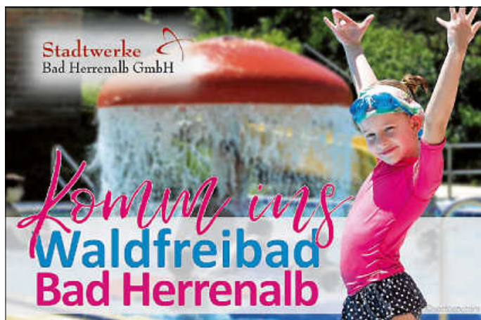
Waldfreibad Bad Herrenalb - Badespaß für die ganze Familie Plakate: Stadtwerke Bad Herrenalb GmbH

Pures Schwimm- und Badevergnügen im natürlichen Quellwasser. Sonnenbaden und Entspannen auf der großzügigen Liegewiese umgeben von herrlichem Grün.