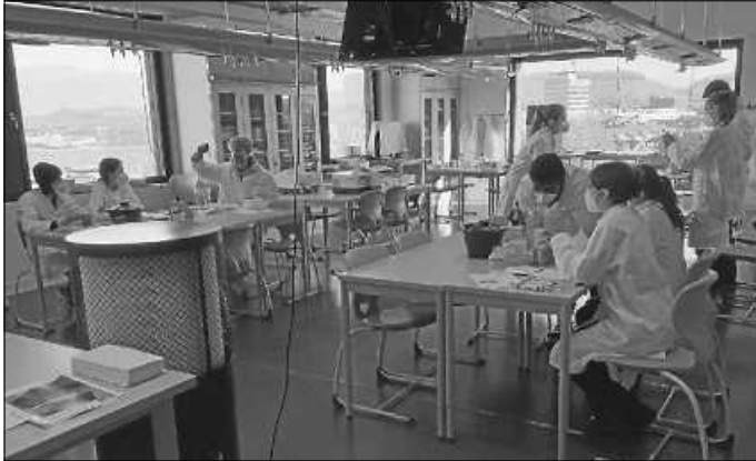
Im Schülerlabor der Experimenta in Heilbronn.

Exkursion der Arbeitsgemeinschaft Neuro- und Molekularbiologie zum GFP-Praktikum der Experimenta Heilbronn