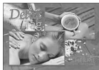
Plakat: Siebentäler Therme

Sanfte Entgiftung – starke Wirkung! Wir helfen Ihnen, vom Alltag abzuschalten und ganz bewusst „Ballast abzuwerfen“, um neue Leichtigkeit zu spüren. Unser Detox-Arrangement unterstützt Sie dabei, den Organismus zu entlasten und Ihren Körper sanft von belastenden Stoffen zu befreien. Insbesondere in Verbindung mit Saunabädern kann der Stoffwechsel aktiviert werden, das Immunsystem gestärkt, das Hautbild geklärt sowie bei Gewichtsreduzierung geholfen und für einen regelrechten Energieschub gesorgt werden.