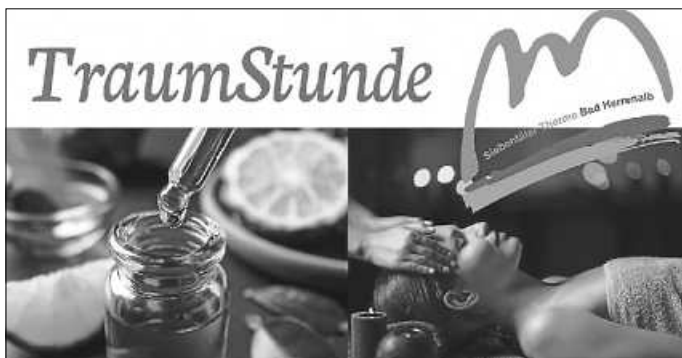
TraumStunde im Wellnessbereich

Plakat: Siebentäler Therme Bad Herrenalb