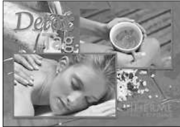
Detox-Tag in der Siebentäler Therme Plakat: Siebentäler Therme

Sanfte Entgiftung – starke Wirkung! Wir helfen Ihnen, vom Alltag anzuschalten und ganz bewusst „Ballast abzuwerfen“, um neue Leichtigkeit zu spüren. Unser Detox-Arrangement unterstützt Sie dabei, den Organismus zu entlasten und Ihren Körper sanft von belastenden Stoffen zu befreien. Insbesondere in Verbindung mit Saunabädern kann der Stoffwechsel aktiviert werden, das Immunsystem stärken, das Hautbild klären, sowie bei Gewichtsreduzierung helfen und für einen regelrechten Energieschub sorgen.