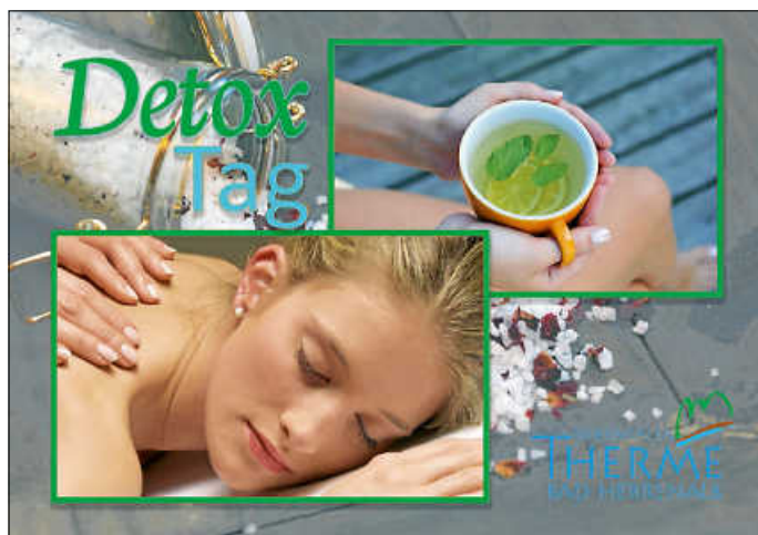
Detox-Tag in der Siebentäler Therme

*Mindestteilnehmer: 4 Personen / max. 6 Personen