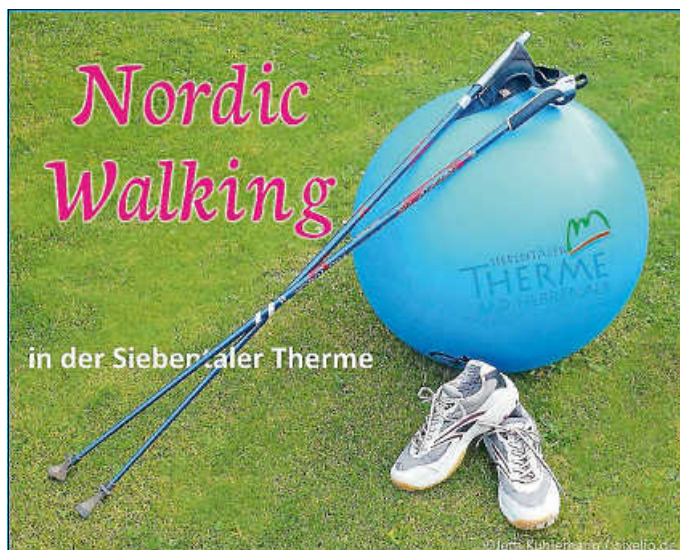
Nordic Walking Kurs in der Siebentäler Therme

Anmeldung und weitere Information unter Tel. 07083 9259 0 oder www.siebentaelertherme.de