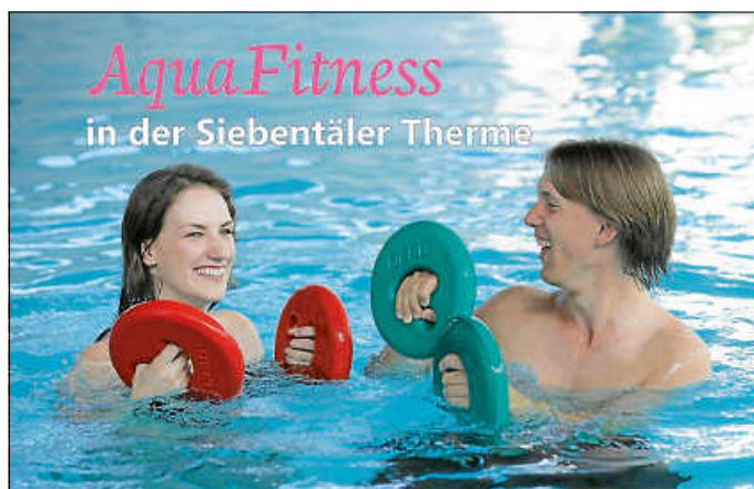
AquaFitnesskurs in der Siebentäler Therme

Anmeldung und weitere Information unter Tel. 07083 9259 0 oder www.siebentaelertherme.de