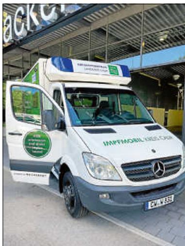
Das Impfmobil kommt am 27.11. und 18.12. ins Kurhaus.

Das mobile Impf-Team des Landkreises Calw macht am Samstag, 27. November und am Samstag, 18. Dezember jeweils von 9 bis 12 Uhr Station im Herrenalber Kurhaus.