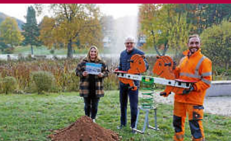
Schweizer Wiese: Eine neue Wippe für den Spielplatz