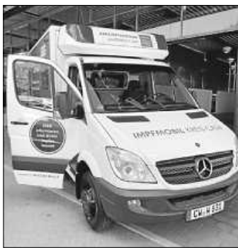
Das mobile Impf-Team kommt am 5. November ins Kurhaus.