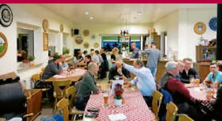
Sportschützenverein: Gesellige Abende beim Pokalschießen