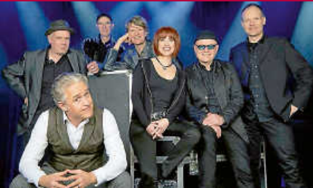
Still-Collins: Konzert fällt aus!