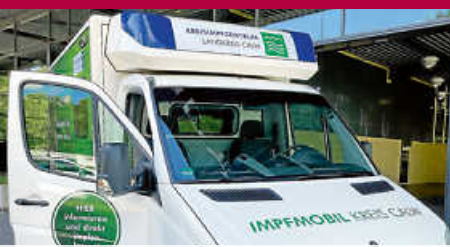
Das Impfmobil kommt! Freitag, 05.11., 9 - 11 Uhr im Kurhaus.