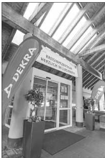
Das Kreisimpfzentrum in Altensteig-Wart schließt am 30. September 2021