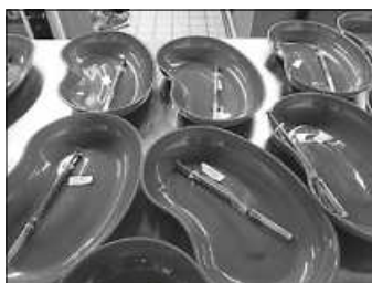
Auffrischimpfungen starten ab dem 1. September 2021.

Ab Mittwoch, 1. September 2021, starten im Landkreis Calw die Auffrischimpfungen gegen das Corona-Virus. Zunächst erhalten Menschen über 80 Jahre, Personen, die in Pflegeeinrichtungen, Einrichtungen der Eingliederungshilfe oder weiteren Einrichtungen mit vulnerablen Gruppen behandelt, betreut oder gepflegt werden oder dort leben, Pflegebedürftige, die zuhause gepflegt werden sowie Personen mit einer angeborenen oder erworbenen Immunschwäche oder unter immunsuppressiver Therapie die Impfdosis. Sie können ab Mittwoch im Impfzentrum, auf Nachfrage beim Hausarzt oder der Hausärztin sowie bei der Betriebsärztin oder beim Betriebsarzt geimpft werden. Voraussetzung ist, dass die Zweitimpfung – oder bei Johnson und Johnson die erste Impfung – mindestens sechs Monate zurückliegt.