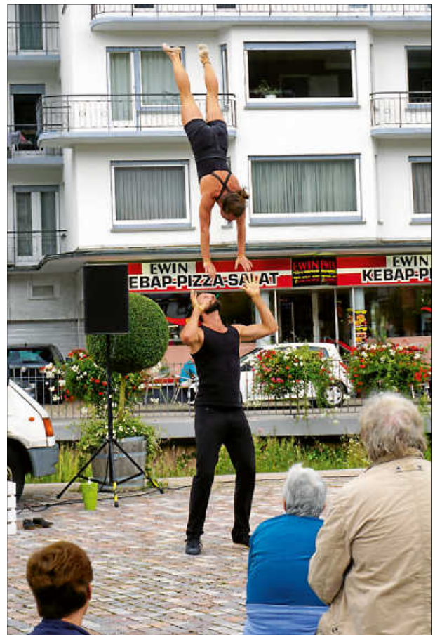
Chris und Iris präsentierten Körperbeherrschung auf hohem Niveau.

Für den musikalischen Teil des Nachmittags war Sänger und Gitarrist Justin Nova zuständig. Musikwünsche aus dem Publikum wurden von ihm genauso souverän und mitreißend vorgetragen wie seine Eigenkompositionen.