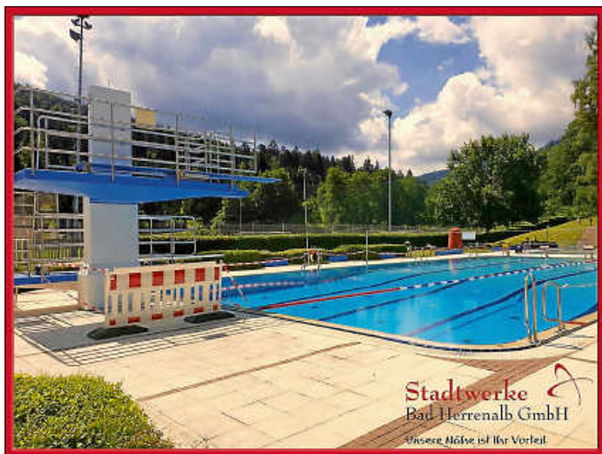
Freibad-Saison kann starten

Das ganze Team freut sich auf ein Wiedersehen und auf eine sonnige Waldfreibad-Saison