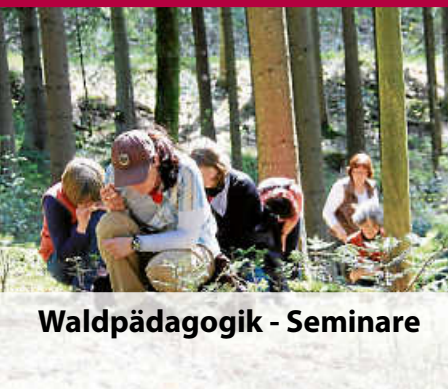
Waldpädagogik - Seminare