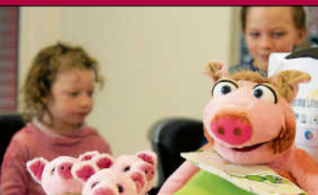
DRK: Hygieneschulungen für Erzieherinnen