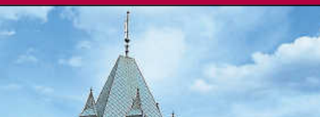
Corona-Schnelltests: Do 27.05. von 15 – 19 Uhr, Sa 29.05. von 10 - 13 Uhr und Mo 31.05. von 18.15 – 20 Uhr