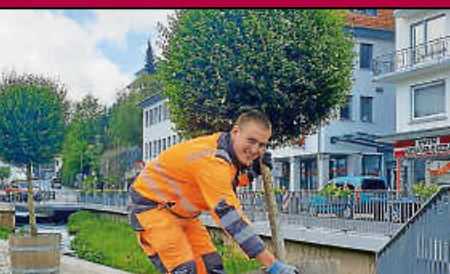
Bauhof: Bad Herrenalb wird grün