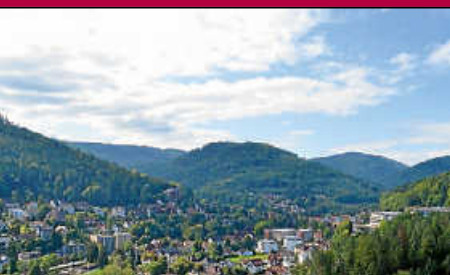
Bürgerbeteiligung 2030: Auswertung liegt vor