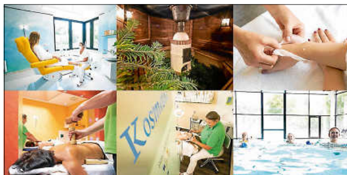
Siebentäler Therme Impressionen

Unser Online-Shop steht Ihnen weiterhin zur Verfügung und Gutscheine können postalisch erworben werden.