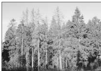
Schadholz bietet Lebensraum für den Borkenkäfer.