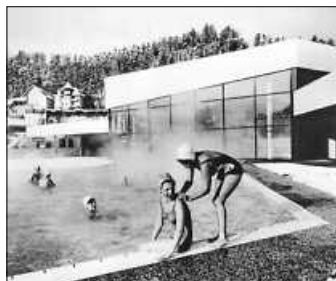
50 Jahre Siebentäler Therme in Bad Herrenalb: Zeitzeugnisse und Zeitzeugen gesucht!

Die Eröffnung der Therme auf der Schweizerwiese am 2. Januar 1971 und die Verleihung des Prädikats „Bad“ an die Stadt Herrenalb am 20. Oktober 1971 sollen mit einer Ausstellung gewürdigt werden.