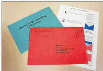
Die Briefwahl-Unterlagen können bequem per Internet bestellt werden.