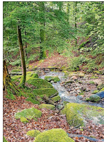
Nominiert als schönster Wanderweg Deutschlands: Der ALBTAL.Abenteuer.Track.

Das Wandermagazin sucht auch in diesem Jahr nach Deutschlands schönstem Wanderweg. Zur Wahl stehen in der Kategorie Tagestouren 14 Wege, in der Kategorie Mehrtagestouren stehen insgesamt zehn Wanderwege zur Auswahl, darunter der beliebte ALBTAL.Abenteuer.Track. Die Wahl ist eine reine Publikumswahl, bei der jede Stimme zählt. Deshalb: Gehen Sie auf die Webseite www.wandermagazin.de/wahl-lokal und stimmen für den ALBTAL.Abenteuer.Track! Wer keinen Internet-Anschluss hat, kann auch per Post wählen, die entspre-