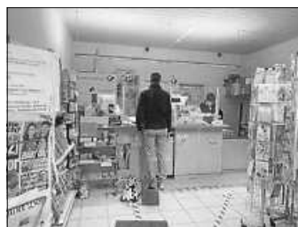
In der Postfiliale Bad Herrenalb stehen zwei Kundenschalter zur Verfügung.