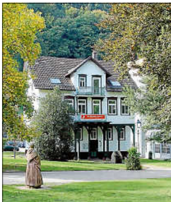
Das Ziegmuseum Bad Herrenalb.

Durch die Corona-Krise mussten auch die Museen im Kreis Calw ihre Pforten schließen, manche konnten erst gar nicht ins Museumsjahr 2020 starten. Inzwischen haben etliche Museen wieder geöffnet, manche müssen aber geschlossen bleiben.