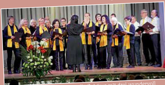
Der Sunshine Chor begeisterte die Zuhörer mit drei wundervoll gesungenen Songs.