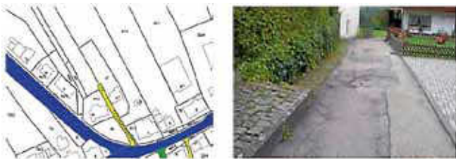
Lageplan zur Beschlussvorlage Nr. 112/2019

112/2019: Der Gemeinderat hat nach Kenntnisnahme der Sachverhaltsausführungen und der einzelnen Abwägungsgesichtspunkte der in § 1 IV – VII BauGB ausgeführten Belange festgestellt, dass eine endgültige Herstellung von Flst. Nr. 70 (Schwarzwaldstraße - Stich) im Sinne von § 125 II BauGB den Anforderungen von § 1 IV – VII BauGB entsprechen wird. Die Lagepläne (siehe Grafik), die dem Beschlussantrag beigelegt waren, sind Bestandteil des Beschlussantrages.