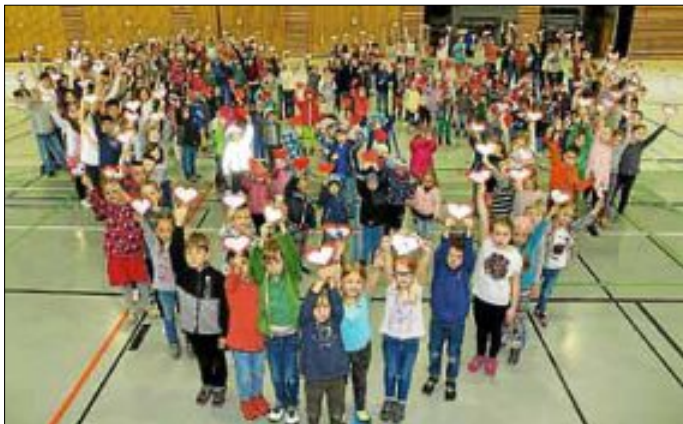
Kinder der Grundschule und des Kindergartens haben Herzen gebastelt. Am Muttertag werden sie im Rahmen des Frühlingsfestes den Müttern überreicht