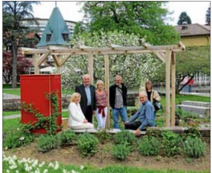
Die Mitglieder der Interessengemeinschaft Gartenschau freuen sich auf das Frühlingsfest