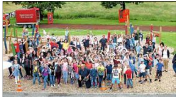
Falkensteinschule Bad Herrenalb