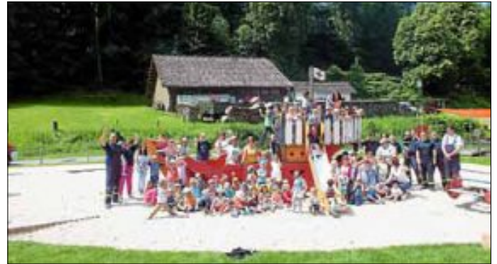
Kinderhaus Bad Herrenalb

Zum Schluss gab es noch eine Brezel für jeden, bevor die Feuerwehr sich mit Blaulicht und Martinshorn verabschiedete.